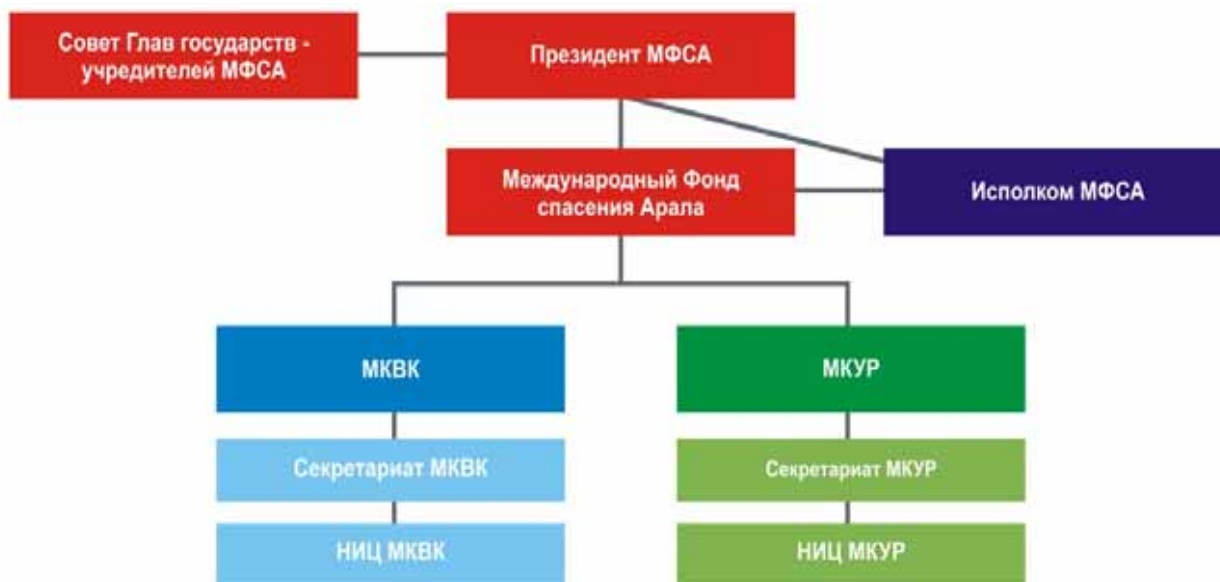
Рис. 2. Структура МФСА

окружающей среды Аральского бассейна, мобилизация средств на проведение совместных мероприятий по охране воздушного бассейна, водных и земельных ресурсов, растительного и животного мира, участие в реализации международных программ и проектов по спасению моря и экологическому оздоровлению бассейна Аральского моря.