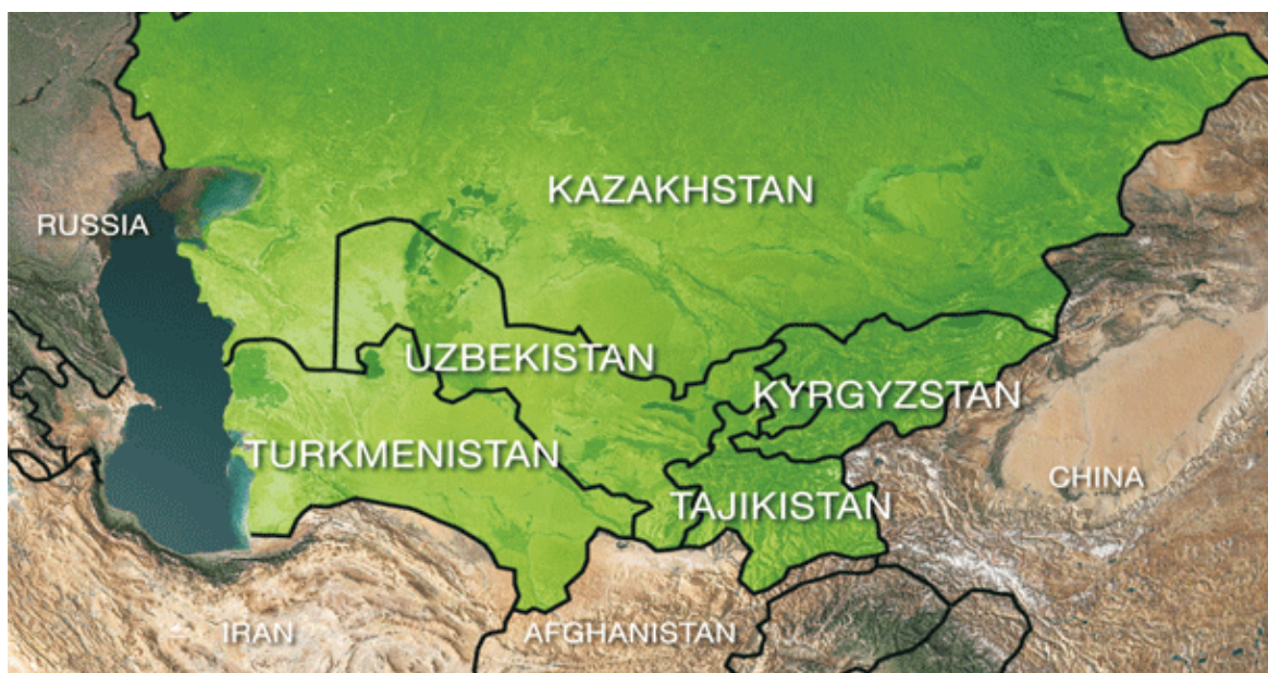
Рис. 1. Карта Центральной Азии

Источник: UNDP. Regional Water Intelligence Report Central Asia. Stockholm