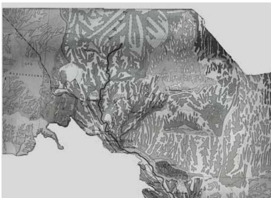
Рис. 2 Выявление с помощью метода «пластики рельефа» особенностей распределения направлений водных потоков и особенностей макрорельефа дельты реки Амударьи. Для уточнения микрорельефа использовали космоснимки Google.