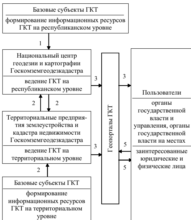
СХЕМА ведения государственного кадастра территорий (ГКТ)

* Стрелками обозначены направления движения информации.