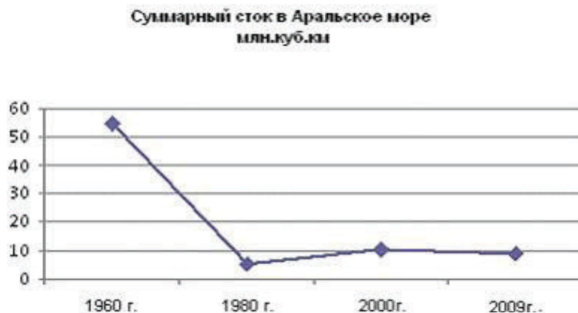
Рис. 2. Изменение суммарного стока Аральского моря по годам

2 можно увидеть изменение суммарного стока в Аральское море. Если в 1966 году он составлял около 55 млн. км 3 , то в 1980 году составляет 5 млн. км 3 . В 2009 году поднимается на уровень 10 млн. км 3