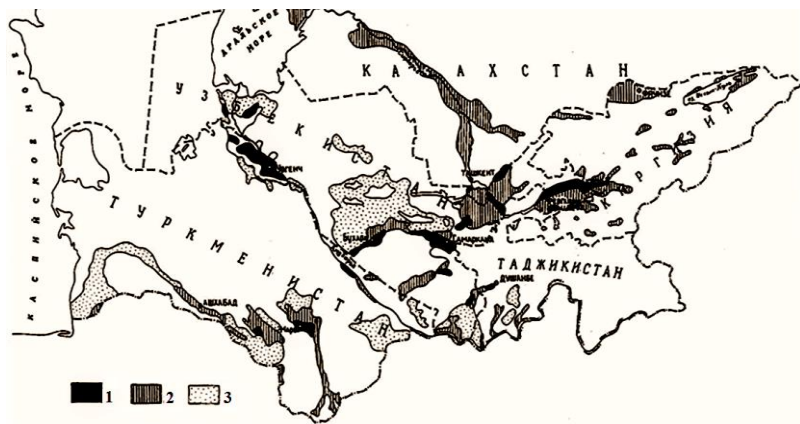
Рис. 1. Распространение орошаемых земель в пределах Среднеазиатского региона (Ирригация Узбекистана, 1979). Условные обозначения: 1 – староорошаемые земли, 2 – орошаемые и новоорошаемые, 3 – пригодные для орошения. Fig. 1. Irrigated lands distribution in the middle-Asian region (Irrigation ..., 1979). Legend: 1 – old-irrigated lands, 2 – irrigated and newly irrigated lands, 3 – lands suitable for irrigation

Поэтому мы сочли возможным и даже необходимым вернуться к этой проблеме, кратко изложить свои взгляды и выделить новые проблемы, возникшие в последние десятилетия, связанные с развитием вторичного засоления на орошаемых землях Средней Азии.