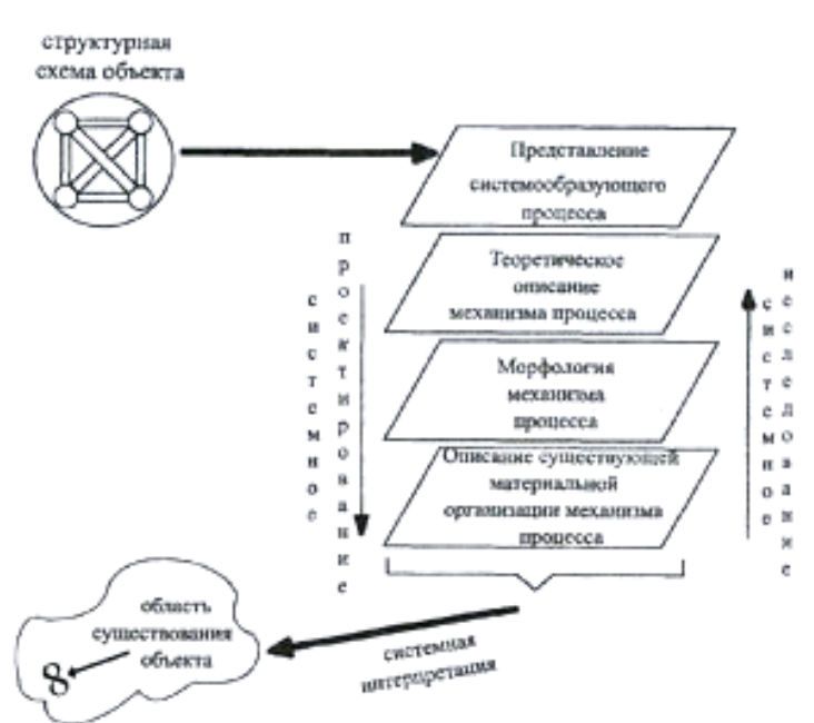
Рис. 3. Схема понятия системы-2.

тегорией система-1 (рис. 2) реально существующего объекта как структурированного целого, а затем представление его еще на четырёх уровнях знания (рис. 3), (за основу рисунков 2 и 3 взяты схемы 4.1. и 4.2., «Музей схем Г.П. Щедровицкого», А.П. Зинченко «Педагогическая инженерия» - Киев, 1997 - 164 с), т.е. описание: