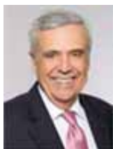
Benedito Braga, President of the World Water Council

Наша приверженность укреплению политической воли более чем очевидна, даже если не существует универсального подхода. Каждая страна имеет свой уникальный комплекс физических, социальных, экономических, политических и природных условий, которые определяют ее путь к водной безопасности и устойчивости. Тем не менее, мобилизация политической поддержки для решения водных проблем на каждом уровне в каждом регионе мира остается долгом Всемирного Водного Совета и его членов.