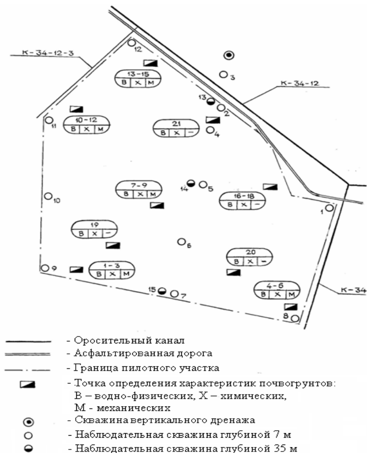
Рисунок 1 - Схема опытно-производственного участка

Для исследования работы вертикального дренажа в современных условиях в Казахской части Голодной степи была восстановлена скважина, а рядом оборудован опытно-производственный участок (рисунок 1).